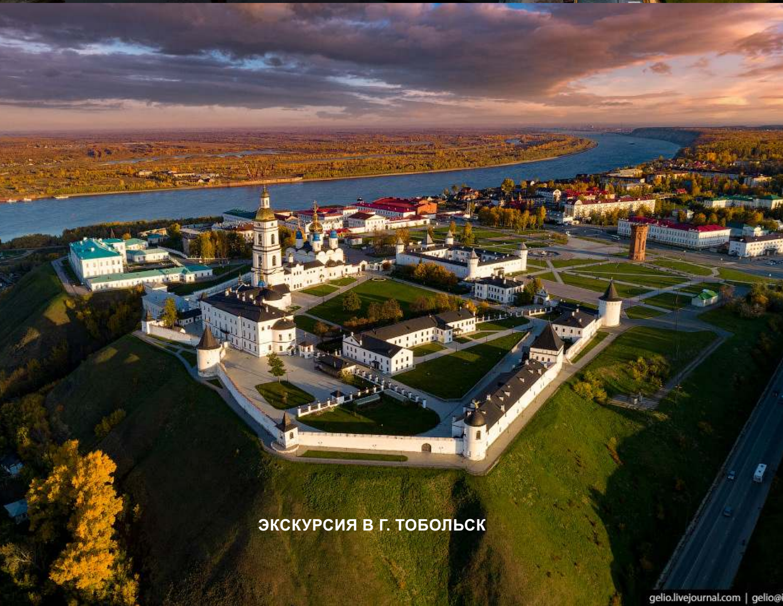
ЭККУРСИЯ В Г. ТОБОЛЬСК