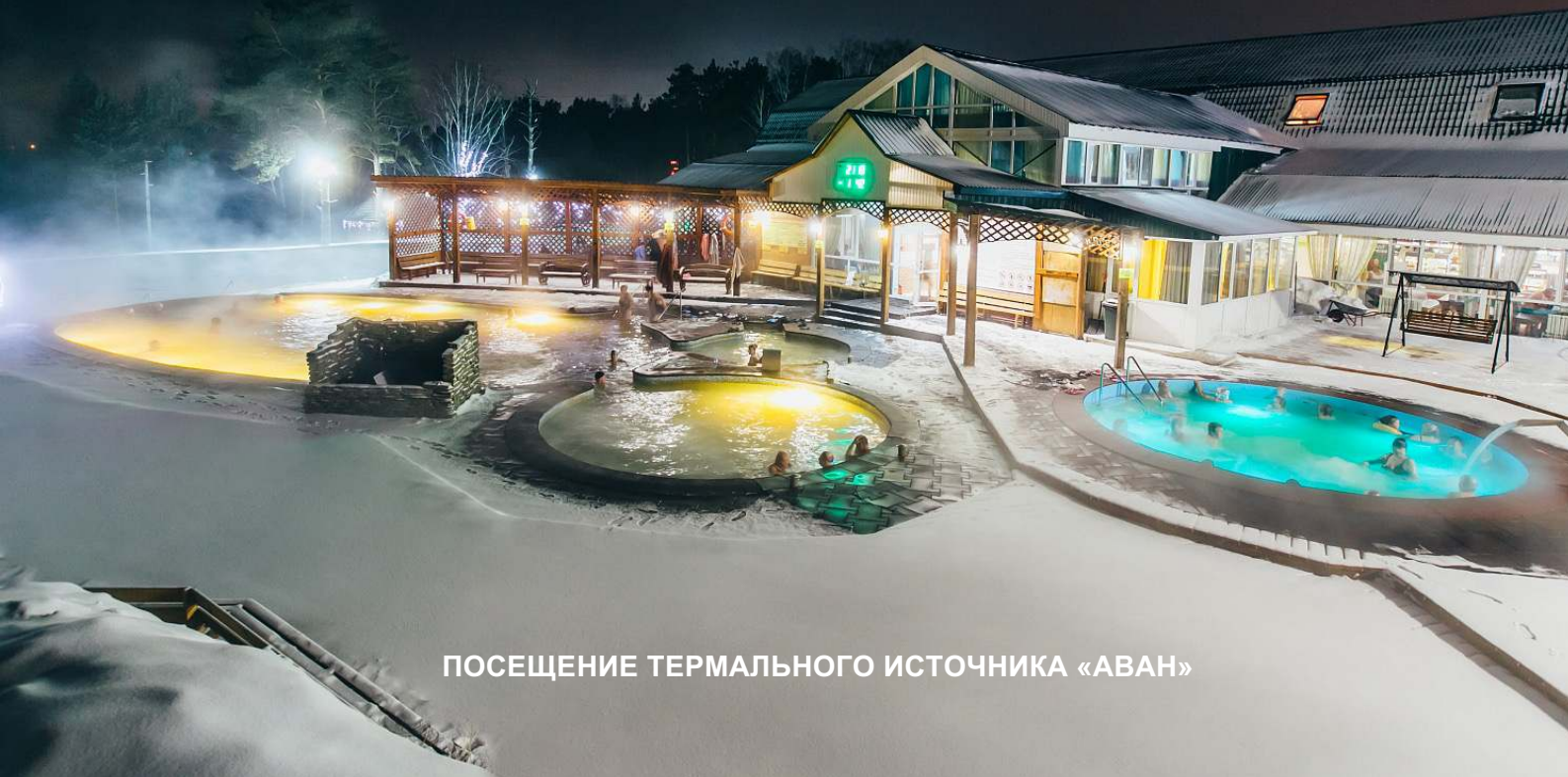
ПОСЕЩЕНИЕ ТЕРМАЛЬНОГО ИСТОЧНИКА «АВАН»